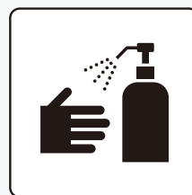
手指消毒 Hand sanitization 手指消毒